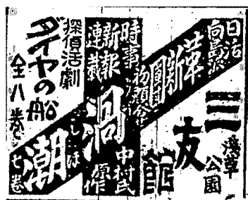
【図3】三友館の宣伝広告 (『萬朝報』1923年1月15日(4)より)

品の『黄金の湖』と同一の、知名度のあるデクラ・ピオスコープ社であることがこれに当たる。つまり、シリーズ物である本作品の性格には注意は払われず、前作品との関連から独立した1つの物語として、単なる「探偵活劇」として公開されていることが分かる。もっとも前作品の酷評を考慮すれば、その関連を示す必要性はないかもしれない。さらに言えば、宣伝に取り上げられても充分通用するであろう俳優陣の出演も同様に関心が払われていない。本作品公開時点まで