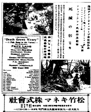
【図5】『死滅の谷』の宣伝広告 (『キネマ旬報』第123号より)

驚異すべき獨逸映畫界は又しても名篇を生めり。構想の奇異卓抜なる、演技の神妙なる、而して背景装置採光等技術的方面の底しれざる技能等は活動寫眞藝術に奈邊迄の新境地を開拓せんとするや、見る者をして讚嘆し之れを久しうせしめずんばやまざるべし。神秘なる映畫詩 映畫藝術の新境地 (下線は引用者による)